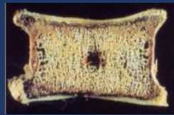
きめが細かくて丈夫