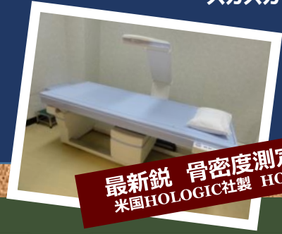
最新鋭 骨密度測定装置 米国HOLOGIC社製 HORIZON