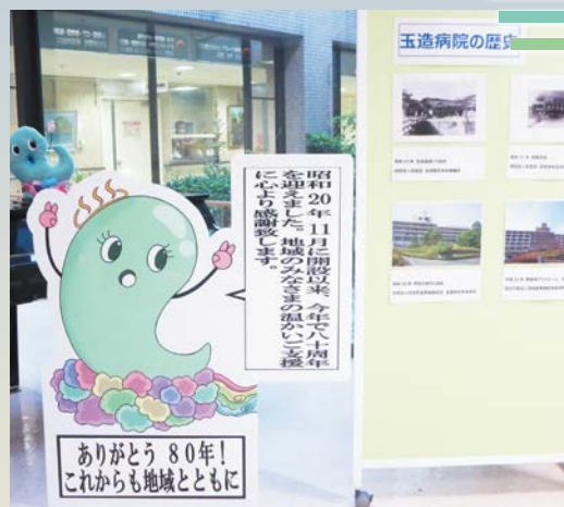
80周年記念で作成したパネル