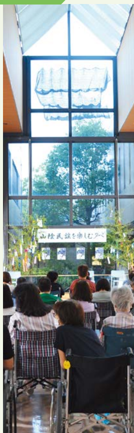
開演を待ち望む皆さんの様子