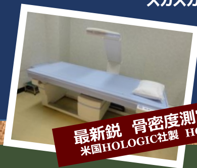
最新鋭 骨密度測定装置 米国HOLOGIC社製 HORIZON