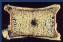
きめが細かくて丈夫