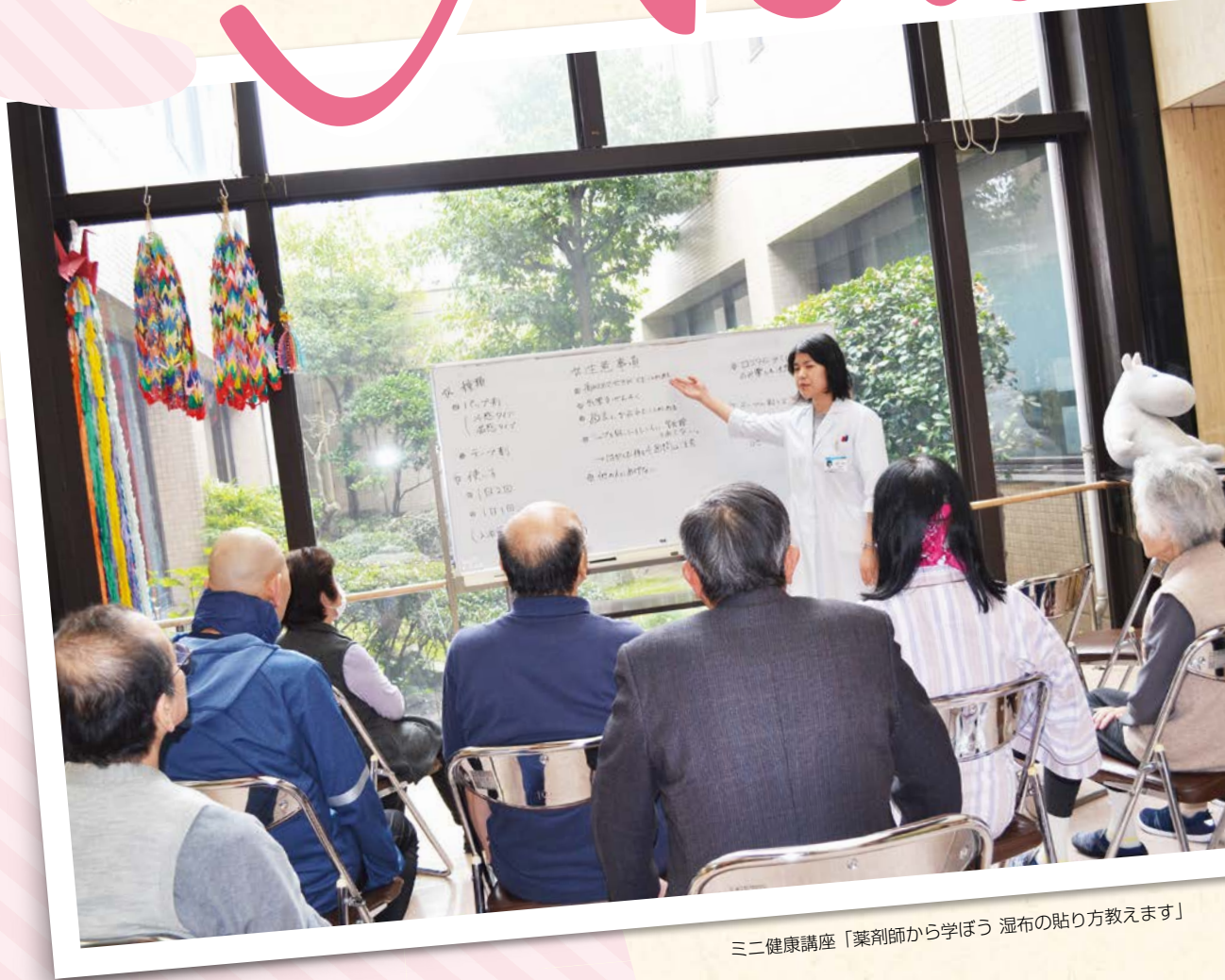
三二健康講座「薬剤師から学ぼう 湿布の貼り方教えます」

窓から穴道湖を臨み、広がる青空。 緑に恵まれた玉湯の丘で期待に応える病院を目指します。