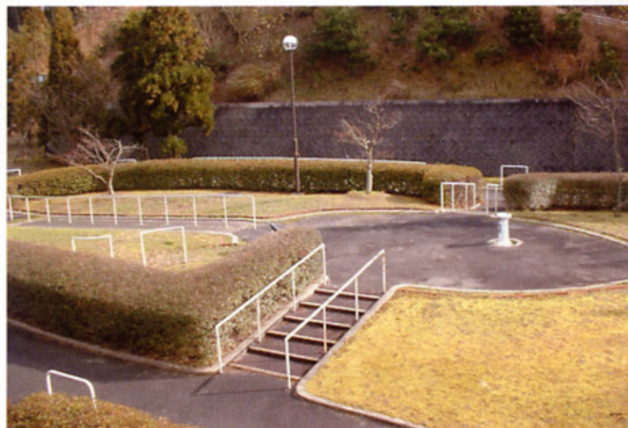
リハビリ屋外訓練場