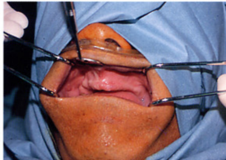
術前の歯の抜けた状態

たくさんの患者さんより、「手術は痛くなく、人工の歯が入った時には自分の歯のように噛めるようになり、食べ物をとておいしく食べられるようになった。」「入れ歯と違って、元のようにうまくしゃべられるようになった。」との感想をいただいています。この人工歯根療法を受けるための最低の条件は、1) 糖尿病や血液の病気がないこと、2) 人工の歯根を植えられるだけの十分な顎の骨があること、3) 自分の口の中は、自分で清潔に保てる習慣が出来ている、ことです。3) につきましては、この療法を開始する前に歯石除去等、歯や口の清掃とプラークコントロールなど徹底的な口腔衛生指導をさせていただきます。