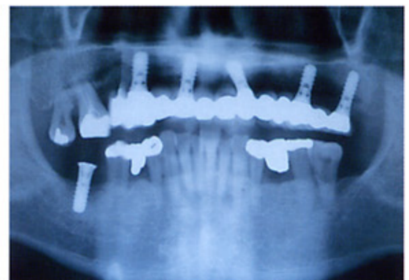
術後のパノラマX線像