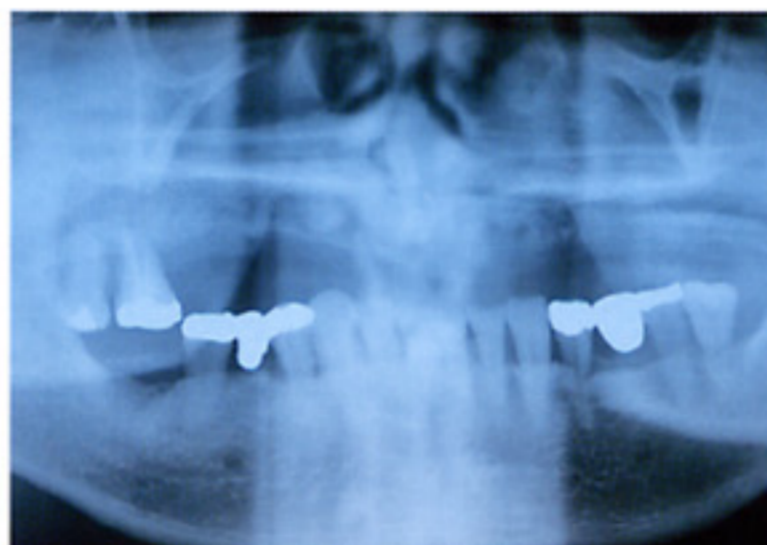
術前のパノラマX線像