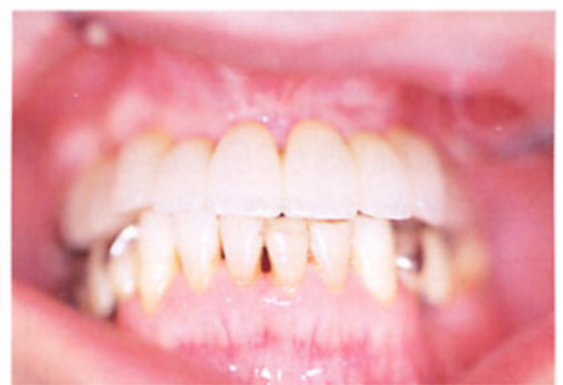
人工歯の歯冠形態