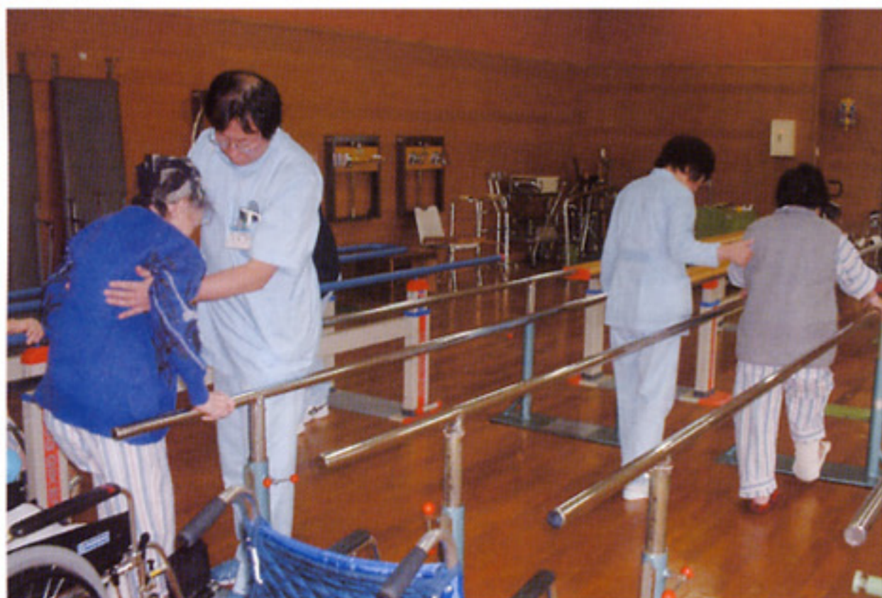
支持棒を使った歩行訓練