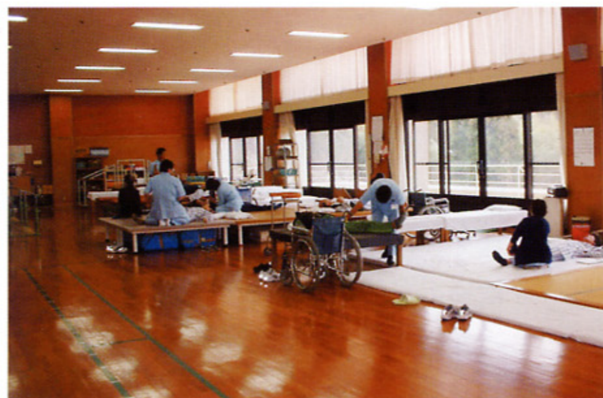
リハビリテーション室での機能訓練

患者さまの現在おかれている状況を評価し、チームでゴールの設定を行い、それに向かった訓練計画を立ててアプローチしています。必要に応じては家屋状況の調査や改修の提案、訪問も行っています。同時に家族指導も行い、自立に向けての支援を行っています。