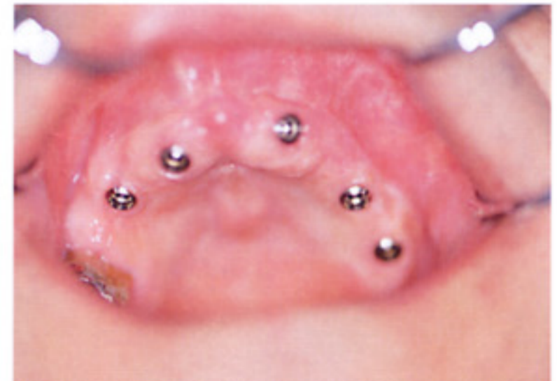
人工歯根が植立された状態