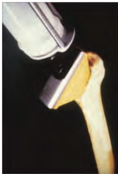
図3 プレッシャライザーを 用いて髓腔に注入した セメントをさらに加圧します