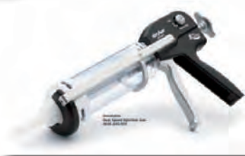
図2 セメントガンを使用して 骨髓腔の奥まで セメントを注入します