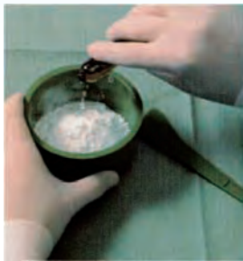
図1 粉末ポリマーと 液体モノマーを混合