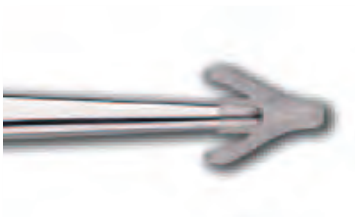
図5 スラム先端が中央にくるように、 セントライザーを使用します

骨セメントはポリメチルメタクリレートから成り、手術中に粉末のポリマーと液体のモノマーを混合させて使用します（図1）。混合後約10分で硬化したセメントとなります。主に人工関節と骨とを固定する接着剤として使われますが、耐熱性の抗菌薬を混ぜて局所的に抗菌薬を徐放するキャリアとして用いられることもあります。